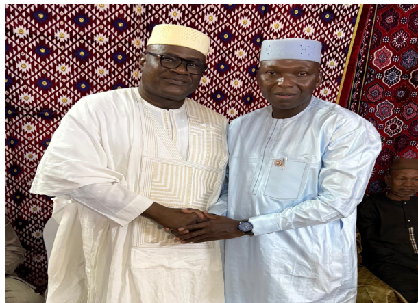
Le Directeur Général de la CANAM