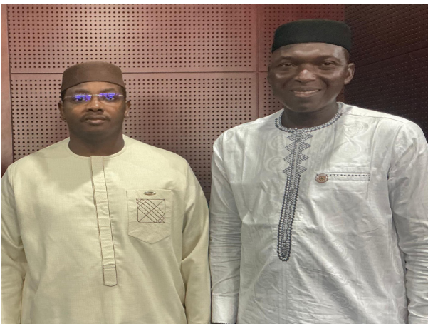
Président de l'AMARTP